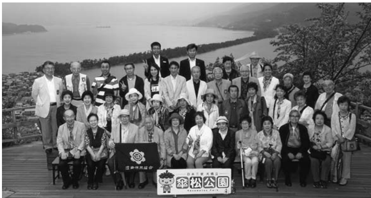
日本三景「天橋立」と温泉情緒たっぷり城崎温泉の旅(2泊3日)

創立65周年 記念旅行 日本三景「天橋立」と温泉情緒たっぷり城崎温泉の旅 平成29年6月7日(水)～9日(金)の3日間実施いたしました。