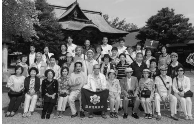
秋の秩父を訪れる「秩父神社ご参拝・長瀬ライン下り」の旅